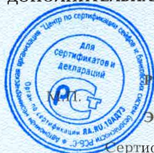
Схема сертификации - 3